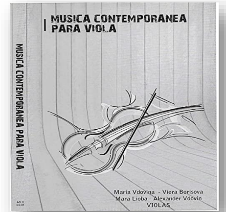
CD I y II “Música contemporánea para viola”

En la interpretación súgnica de una partitura